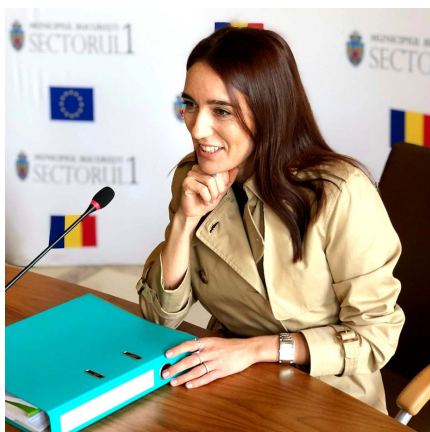
DANIELA POPA VICEPRIMAR SECTOR 1

Vă propun în următoarele pagini o privire detaliată asupra modului în care am ales să contribui la creșterea bunăstării colective a comunității Sectorului 1!