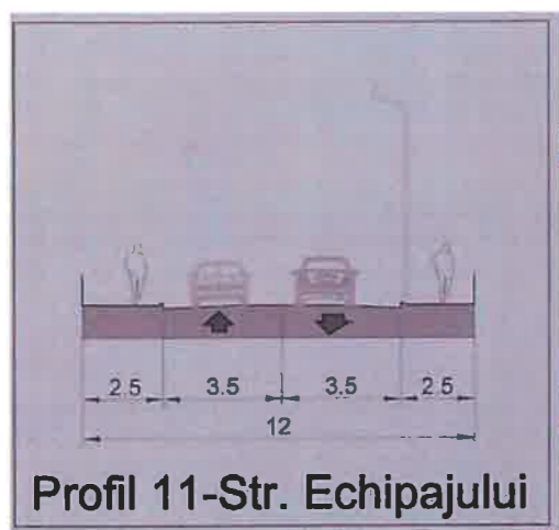
Profil 11-Str. Echipajului