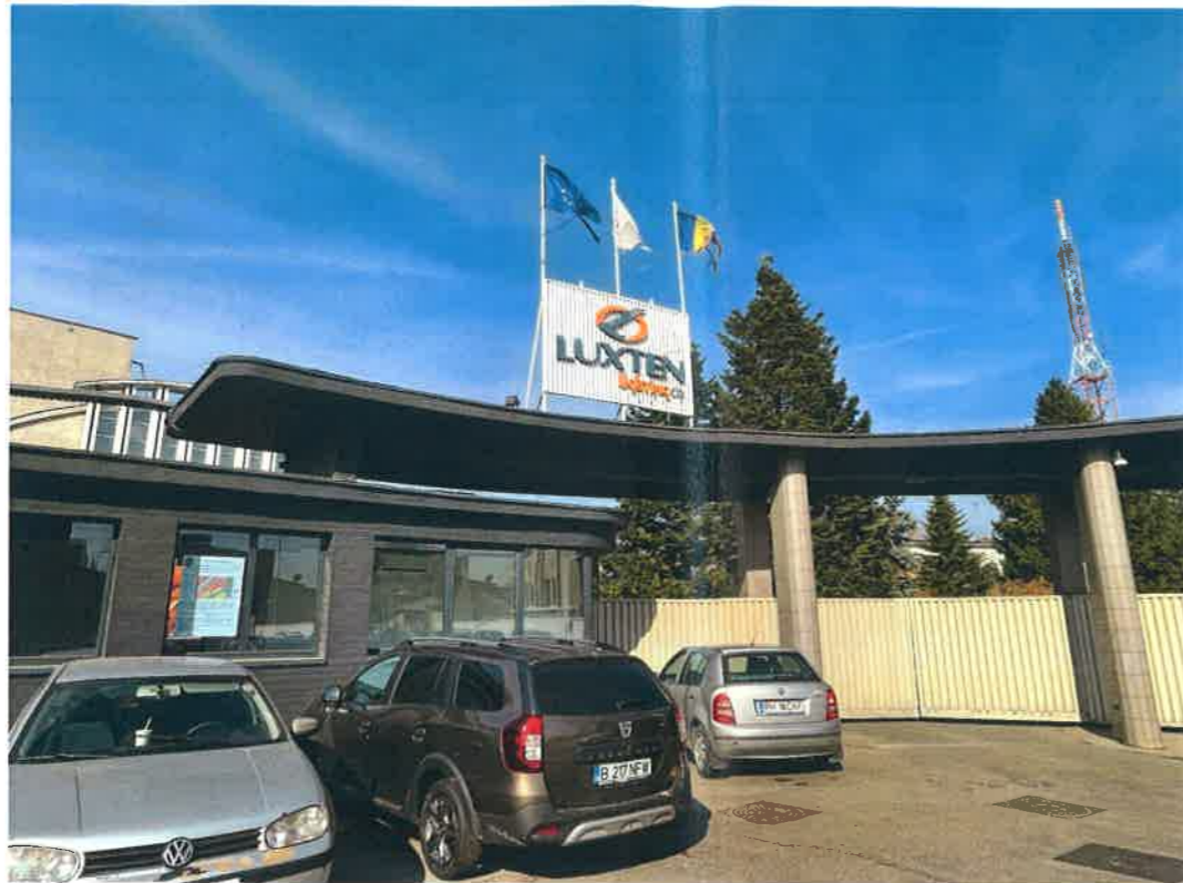
PANOU AMPLSAT PE DATA DE 22.10.2021