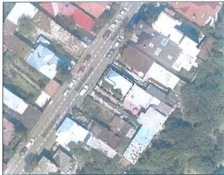
INCADRARE IN ZONA