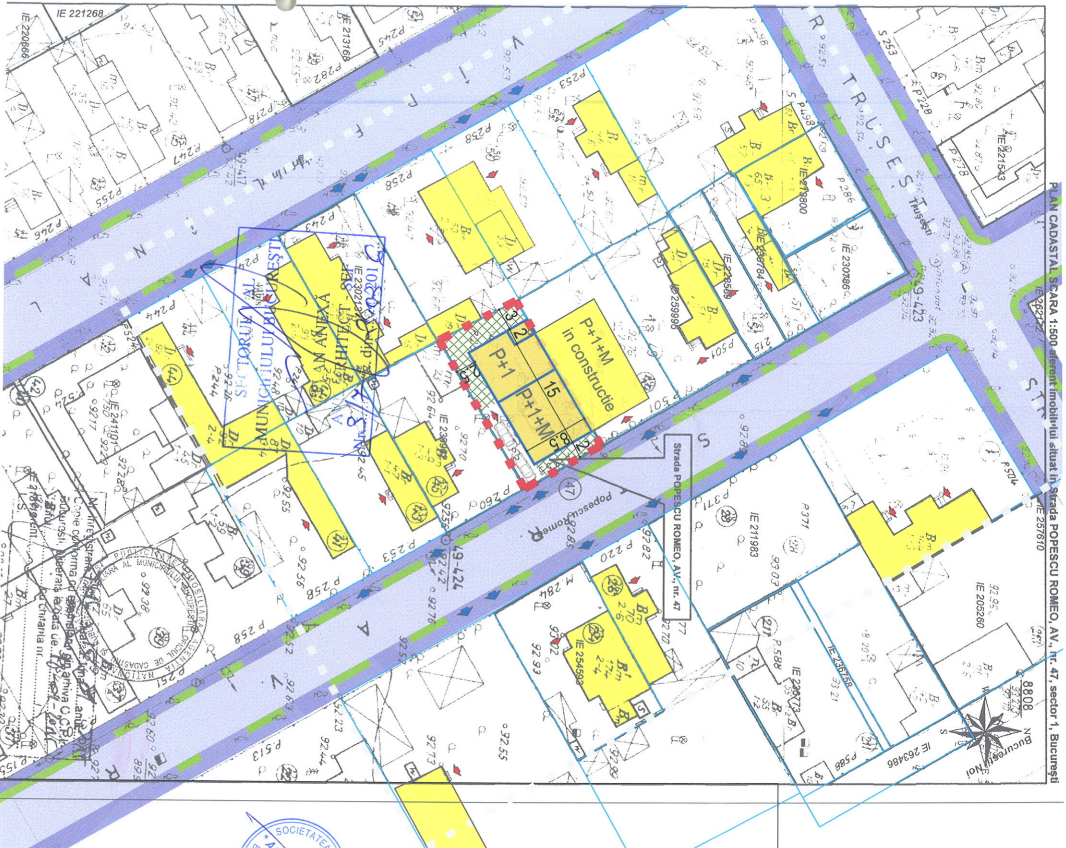
PLAN CADASTRAL SCARA 1:500 aferent Imobilului situat in Strada POPESCU ROMEO, AV., nr. 47, sector 1, Bucuresti

STR. AV. ROMEO POPESCU NR.47 - SUPRAFATA TEREN=250mp Se desfiinteaza constructiile existente. Se propune construire Locuinta unifamiliala P+1+M Sc = 148,8 mp, Scd=381,5mp, RH=P+1+M, Hmax cornisa=8.1m-aliniata la cornisa cladirii invecinate. Se prevad doua locuri de parcare in incinta cf. HCGMB 66/2006.