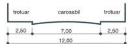
PROFIL STRADAL Strada Gala Galaction si Strada Zablovschi

P.O.T. propus = 41,2 % C.U.T. propus = 1,3 Hmax = 10,0 m.