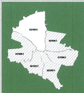
PROFIL PROPUȘ PRIN PUZ INELUL MEDIAN