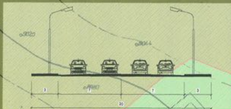
ARTERA PROPUSA 1-1

STRADA DIRIJORULUI NR. 90 - LOT 3, SECTOR 1, BUCURESTI