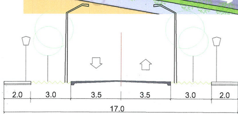
STRADA OASPETILOR Profil existent si reglementat