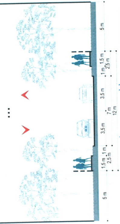
PROFIL STRAZII DRUMUL LAPUS CONFORM PUZ ZONA DE NORD, SECTOR 1, BUCURESTI