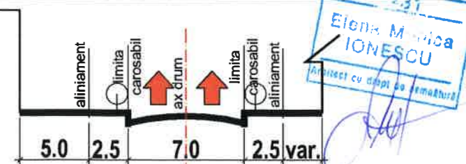
str. TRIBUNEI - PROFIL STRADAL EXISTENT SI MENTINUT

INDICATORI URBANISTICI ZONA M3 POT max=60% CUT max=2,5 RH max=S+P+4E