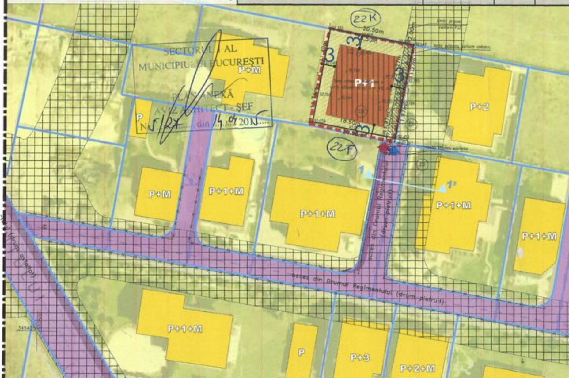
Limite existente conform cadastrului (Nr. cad. 257962)