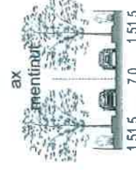
Profil PC1 propus prin PUZ Inel Median sc 1.500