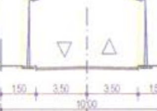
PROFIL TRANSVERSAL SECTIUNEA A-A