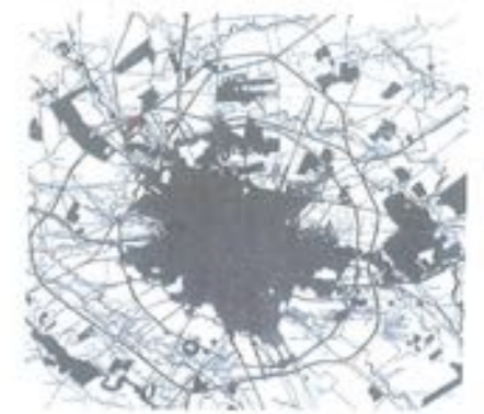
PUD STR. REDEA NR.16 SECTOR 1, BUCURESTI REGLEMENTARI URBANISTICE SC. 1:500