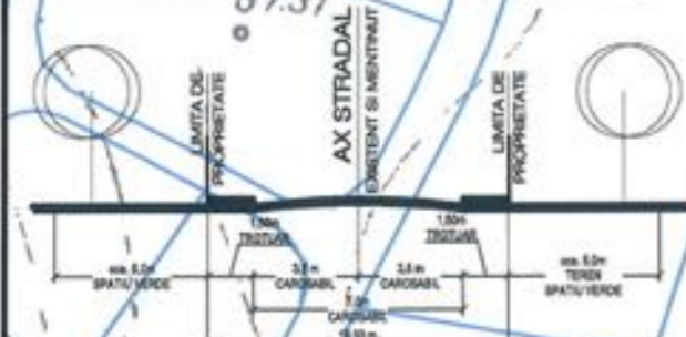
PROFIL CC' - PROPUS PRIN PUZ "SOS. GH. IONESCU SISESTI, NR. 129 - 133"