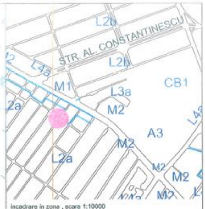
incadrare in zona, scara 1:10000

SECTORUL I AL MUNICIPIULUI BUCUREȘTI PLAN ANEXA AVIZ ARHITECT - ȘEF Nr. 19/13 din 12.2012