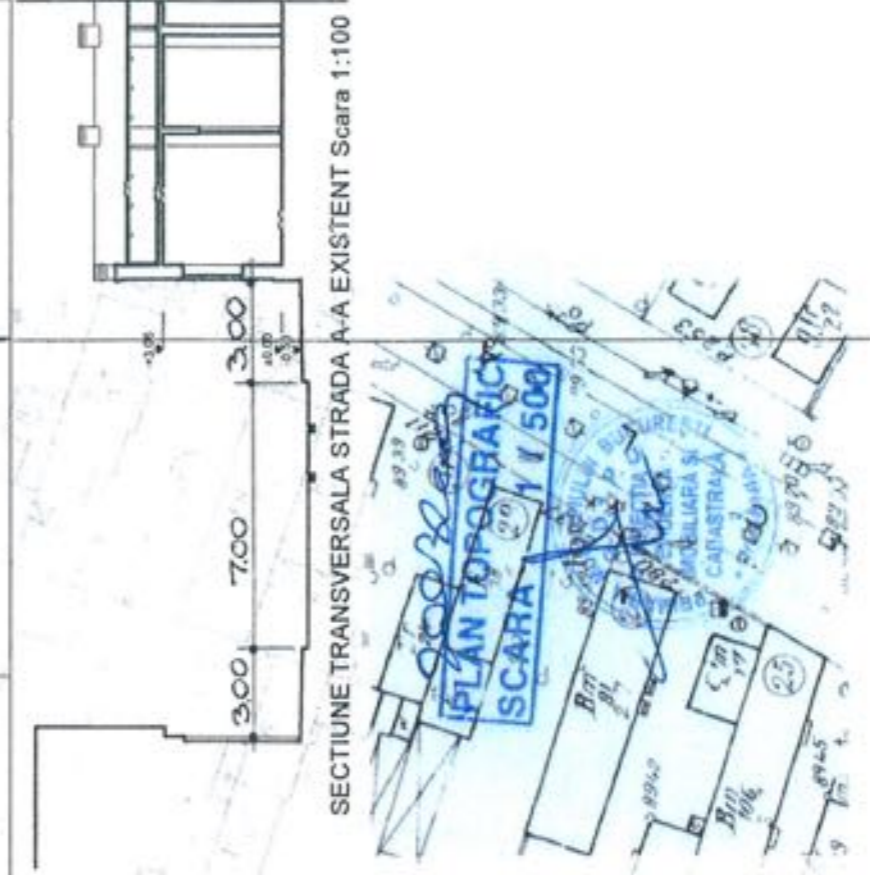
SECȚIUNE TRANSVERSALA STRADA A-A EXISTENT Scara 1:100