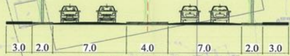
Sectiune transversala prin Sos. Straulesti

Profil propus prin PUZ "Petrom City" aprobat cu HCGMB nr. 145/ 2007