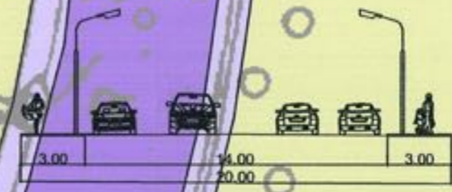
Sectione transversala prin Str Izbiceni

PRIMARIA SECTORULUI I ARHITECT SEF PLAN ANEX LA AVIZUL C.F.O. Nr. 13/0 din 29.06.2010