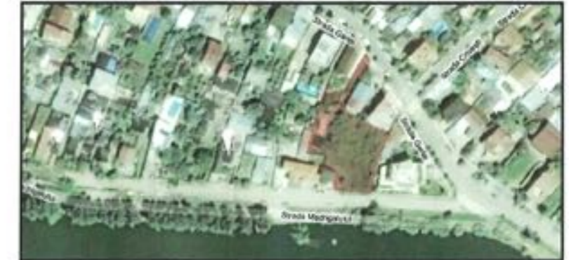
PROFIL PROPUZ - str. MADRIGALULUI

PLAN URBANISTIC DE DETALIU LOCUINTA UNIFAMILIALA P+1E Str. MADRIGALULUI, Nr. 2, Sector 1 - Bucuresti