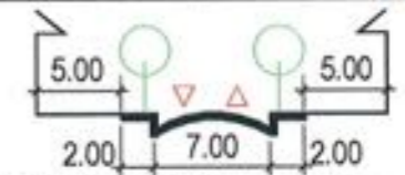
PROFIL STRADAL PROPUSE PRIN "PUZ - str. Lonea nr.21-25"