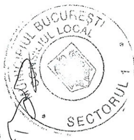
TABEL Planuri Urbanistice de Detaliu pentru construcții definitive pe terenuri situate în Sectorul 1 al Municipiului București