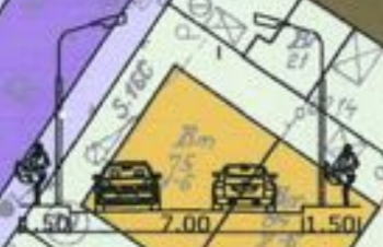
Sectiune transversala prin Str. Aristotel Pappia

PRIMA DE SECTORULUI I ARHITECT SEF PLAN ANEXA LA AVIZUL C.T.U. Nr. 27/12 din 08.10.2009