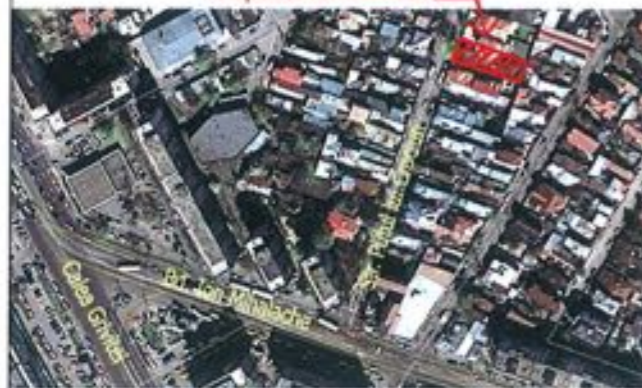
INCADRARE IN ZONA Scara 1:5000